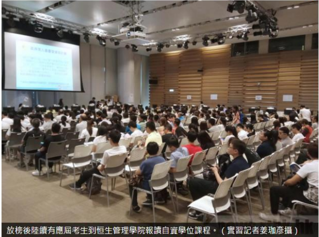
放榜後陸續有應屆考生到恒生管理學院報讀自資學位課程。

中學文憑試放榜，放榜後陸續有應屆考生到恒生管理學院報讀自資學位課程，不少考生認為若未能入讀政府資助學位，報讀自資課程是買個保障。